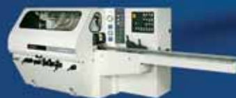
SUPERSET XL - 4-х сторонний автоматический продольно-фрезерный станок