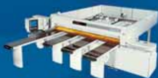
SIGMA 105 C - пильный центр