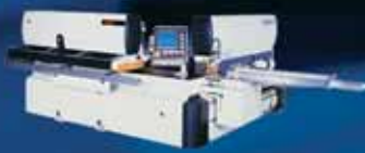
WINDOR 20 - обрабатывающий центр с программным управлением для изготовления дверных блоков и евроокон