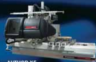
AUTHOR X5 - универсальный обрабатывающий центр с ЧПУ

SCM GROUP представляет собой концерн, в состав которого входят: 9 производственных марок, выпускающих полный спектр станков для обработки массива и плиты, 15 машиностроительных заводов, центр по обучению специалистов. Компания ДОМИНО-З, эксклюзивный дилер SCM GROUP по ЮФО, предлагает более двухсот модификаций станков, предназначенных для любого вида предприятий, от ремесленных мастерских до крупного индустриального производства и обеспечивает квалифицированную техническую поддержку.