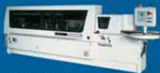
OLIMPIC K208 - односторонний автоматический кромкооблицовочный станок