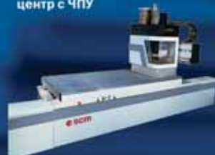
RECORD AL 110 - обрабатывающий центр с ЧПУ