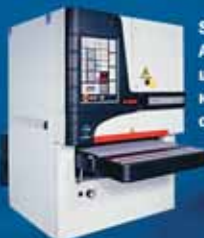
SANDYA 15 - автоматический шлифовально-калибровальный станок