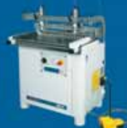
MB21 - одноголовочный сверлильно-присадочный станок с 21 шпинделем