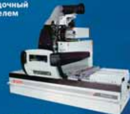
TECH Z 25 - сверлильно-фрезерный центр с ЧПУ