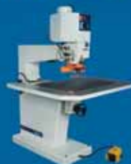
Router - копировально-фрезерный станок с верхним расположением шпинделя