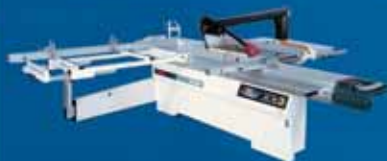
SI 450E - форматно-раскроечный станок с наклоняемой пилой