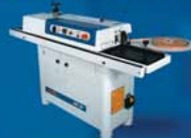
ME20 - автоматический кромкооблицовочный станок