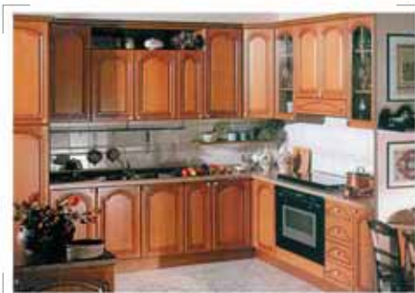
ЗММА (ЕВРОКОМФОРТ), ОТ 22000р. МАТЕРИАЛ: МАССИВ ДУБА

на-Дону, ул. Текучёва, 224, ) 244-29-89 edarostov@mail.ru