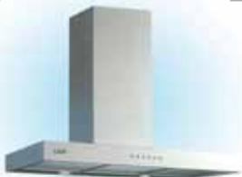
MUSA 900мм - 9920р. (LAUF) 600мм - 9160р.