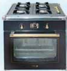
газ.поверхность - 7020 р. эл. духовка - 14670 р.