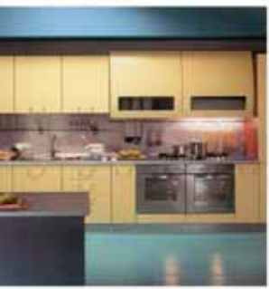
(ЕВРОКОМФОРТ), ОТ 17700р. МАТЕРИАЛ: МДФ