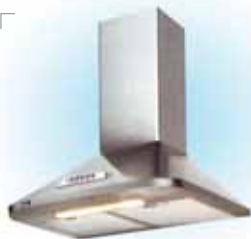
FAGOR СТАЛЬ - 6100р. БЕЛАЯ - 5650р. ЧЕРНАЯ - 5650р.