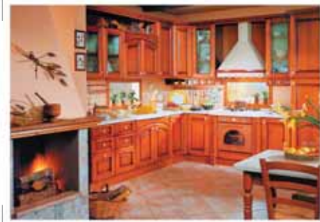
АРМОНИЯ (ЕВРОКОМФОРТ), ОТ 20000р. МАТЕРИАЛ: МАССИВ ЧЕРЕШНИ