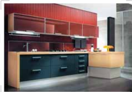
ЗВОЛЮЦИЯ (ЕВРОПРЕСТИЖ), ОТ 35000р. ОСНОВА: МДФ, ОТДЕЛКА: ШПОН ВЕНГЕ И ВЫПИЛЕННЫЙ ДУБ