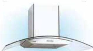
NIOLA 900мм - 11100р. (LAUF) 600мм - 9450р. сталь - стекло