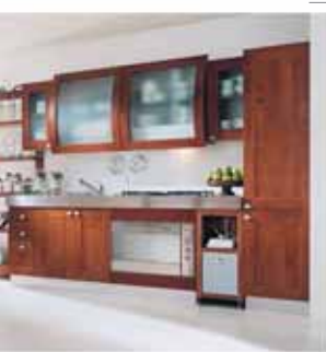
(ЕВРОПРЕСТИЖ), ОТ 32000р. МАТЕРИАЛ: МАССИВ ВИШНИ