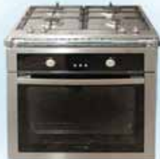
газ.поверхность - 9940 р. эл. духовка (нерж.) - 16450 р. белая, черная - 16000 р.