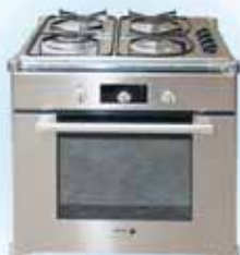
газ.поверхность - 5390 р. эл. духовка (нерж.) - 12400 р. белая, черная - 11240 р.